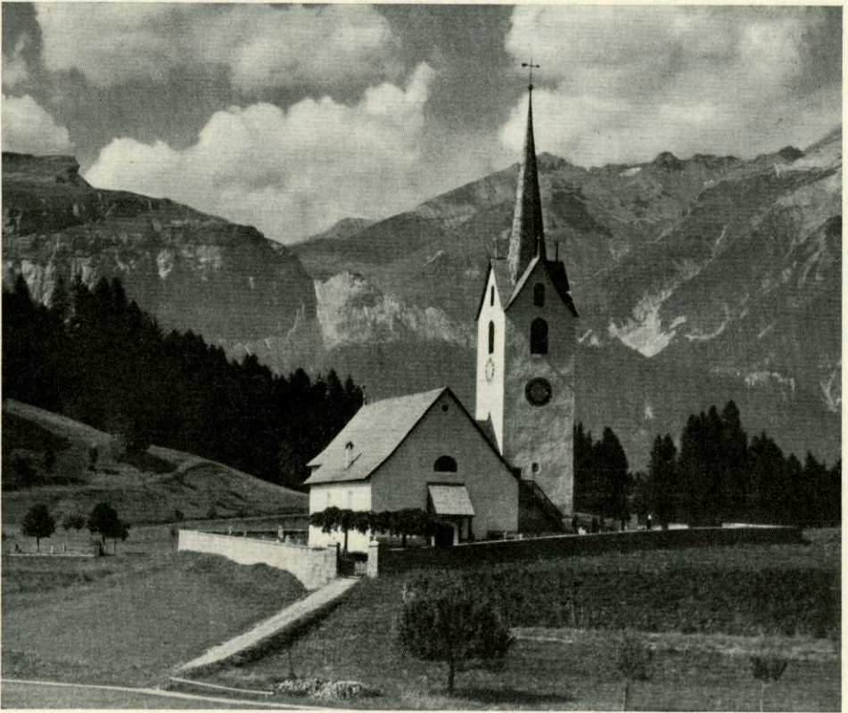
Abb. 150. Versam. — Die Evangelische Kirche. Ansicht von Süden.

Literatur: S. SUTTER-JUON, Aus Versams Vergangenheit, BMBI. 1929, S. 180f., S. 211 f.