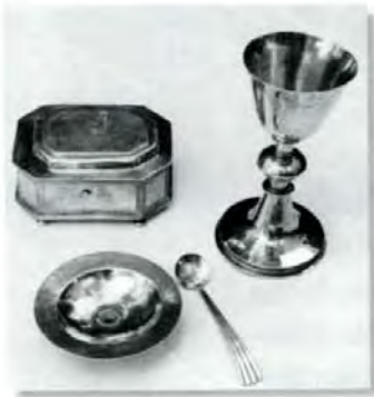
Abendmahlsgeräte aus dem Jahr 1679

Heute steht der Altar unter dem Chorbogen. Es war viele Jahrzehnte ein holzumkleideter Altar, zu dem zwei brüchige, hölzerne Stufen hinaufführten, bis er 1960 nach Plänen des Architekten Prof. H. Seytter durch einen größeren, steinernen ersetzt wurde. In diesem Zusammenhang wurde der ganze Chor auch etwas höher gelegt. Im gleichen Jahr entschied der Kirchengemeinderat, dass der Predigt-Gottesdienst, der bisher allein von der Kanzel aus geleitet wurde, mit dem Dienst am Altar beginnen soll. In der Zwischenzeit hat sich die Ordnung weiterentwickelt, so dass der Pfarrer während des Gottesdienstes nur zur Predigt auf die Kanzel geht.