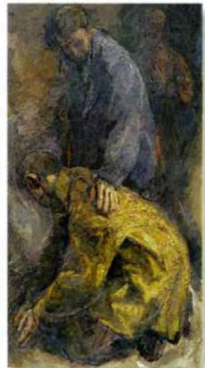
„Ich bin verzweifelt gewesen ...“