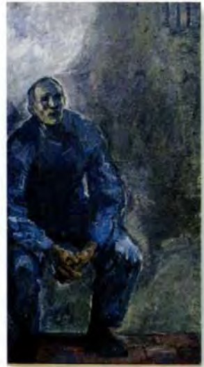
„Ich bin gefangen gewesen ...“