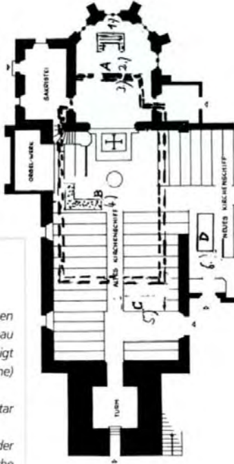
Grundriss der heutigen Jakobus-Kirche mit Anbau (gestrichelte Linie zeigt die romanische Kirche)

150 Männer erbrachten eine Leistung von ca. 42.000 DM der Baukosten. Die Einweihung fand am 3. Advent 1956 statt.