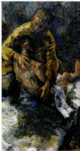
„Ich bin krank gewesen ...“