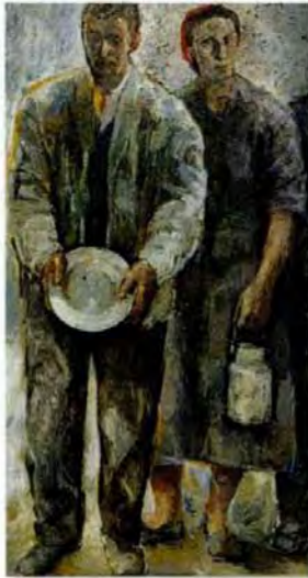
„Ich bin hungrig und durstig gewesen ...“