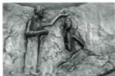
Bronze-Reliefbild Taufe Jesu