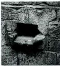
alte Opferschale am Treppenaufgang

Der Kirchenname Gallus geriet später in Vergessenheit. Man sprach nur noch von „der Kirche“. Als dann die zweite evangelische Kirche im Bau war, wurde für sie 1964 der Name Johannes-Kirche ausgewählt, und der Name des älteren Bruders von Johannes, nämlich Jakobus, wurde im September 1965 der „alten Kirche“ in Bernhausen gegeben.