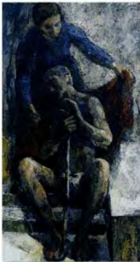
„Ich bin nackt gewesen ...“