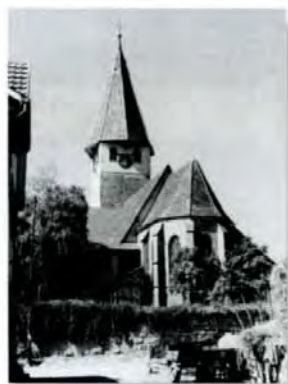
Jakobuskirche 1954 Ostansicht

Um 800, spätestens 850 stand hier vermutlich die erste Kirche, wahrscheinlich eine einfache Holzkirche. Von ihr ist nur bekannt, dass sie dem Heiligen Gallus geweiht war. Er war der bekannteste Heilige des alamannischen Bistums Konstanz, das damals bis über das heutige Stuttgart hinaus reichte und damit auch Bernhausen einschloss. In der Zeit zwischen 804 und 864 n. Chr. gab es Wallfahrten nach St. Gallen. Und so ist es erklärlich, dass die Bernhäuser Kirche eine Gallus-Kirche wurde.