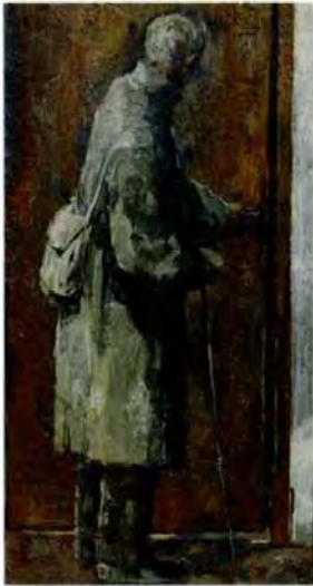
„Ich bin ein Fremder gewesen ...“

Jesus spricht: „ Was ihr getan habt einem von diesen meinen geringsten Brüdern, das habt ihr mir getan“. (Matthäus 25, 40 a)