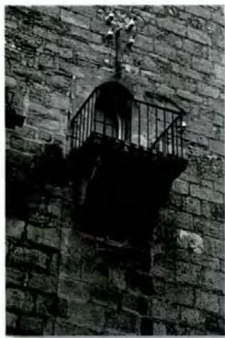
Balkon an der Südseite des Turmes

Der eindrucksvolle Turm aus Quadersteinen ist zusammen mit dem Turmhelm 45 Meter hoch. Der Turm wurde vermutlich nach der Zerstörung Bernhausens im Jahre 1287 erbaut. Er war ursprünglich ein Wehrturm; darauf weisen die fast zwei Meter dicken Mauern und die schießchartenartigen Lichtlöcher hin. Sein Eingang lag in 6 - 8 m Höhe, vermutlich dort, wo 1930 ein kleiner Balkon angebracht wurde. Das Eichenbalken-Fachwerk wurde 1984 freigelegt und in den Originalfarben bemalt.