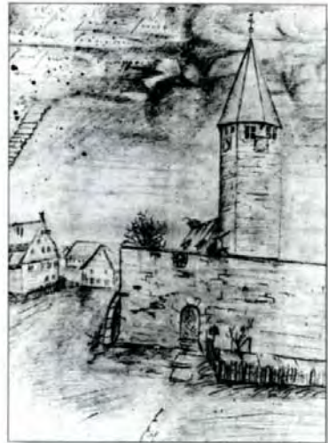
Jakobus-Kirche 1824 (Zeichnung von Eduard Mörike)

Bei den Ausgrabungen 1988 wurden 80 cm von der Ostwand des Chores entfernt die Fundamente eines großen Altars (2,30 m/ 1,30 m) gefunden. Es handelte sich wohl um einen Hochaltar mit Heiligengemälden (Flügelaltar). Dieser ursprüngliche Altar der gotischen Kirche wurde vermutlich 1540 entfernt, als Herzog Ulrich befahl, in allen Kirchen nur einen Altar als Abendmahlstisch übrig zu lassen, und dieser wurde dann weiter nach vorne zur Gemeinde gerückt.