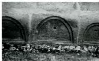
romanische Steine im Fundament

Um 1200 wurde eine romanische Kirche aus Stein errichtet (möglicherweise anstelle einer schon vorhandenen kleineren Steinkirche). Auf die Fundamente stieß man 1988 bei Umbaumaßnahmen der Heizung. Diese Kirche war nach Osten ausgerichtet. Von ihr sind die Grundmauern, der rechteckige Chor und der Ort des Altars bekannt. Sie hatte – einschließlich des Chors – einen Grundriß von etwa 15 m Länge, 7,5 m Breite und eine Höhe von 12 Meter. Sie war damit etwa halb so groß wie die heutige gotische Kirche; ihre Grundmauern entdeckte man innerhalb der heutigen Kirche. Ihr Schiff hatte eine nach Norden verschobene Achse und reichte wohl zunächst nicht bis zum heutigen Turm, wurde aber später bis dahin erweitert, was bauliche Hinweise an der Ostseite des heutigen Turms (sichtbar von der Kirchenbühne aus) nahelegen.